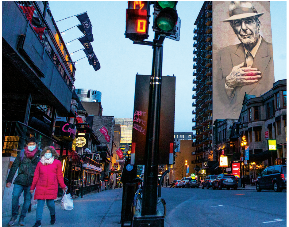
La populaire rue Crescent. Montréal, 19 avril 2020.