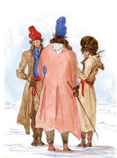
Aquarelle de John Crawford Young représentant des Canadiens vers 1825. Ces « Habitants » sont reconnaissables à leurs longs manteaux en « étoffe du pays » (mélange de laine et de lin), ainsi qu'à leurs ceintures nouées autour de la taille et à leurs tuques bleues ou rouges. Les plus nantis portent le chapeau de fourrure et le « capot de chat » (manteau de fourrure pour homme).

Ajoutons que la Communauté métropolitaine de Québec présente l'une des populations les plus homogènes en Amérique du Nord, si on la compare avec les autres agglomérations de taille semblable. En effet, plus de 90 % de ses habitants sont des leucodermes aux racines françaises.