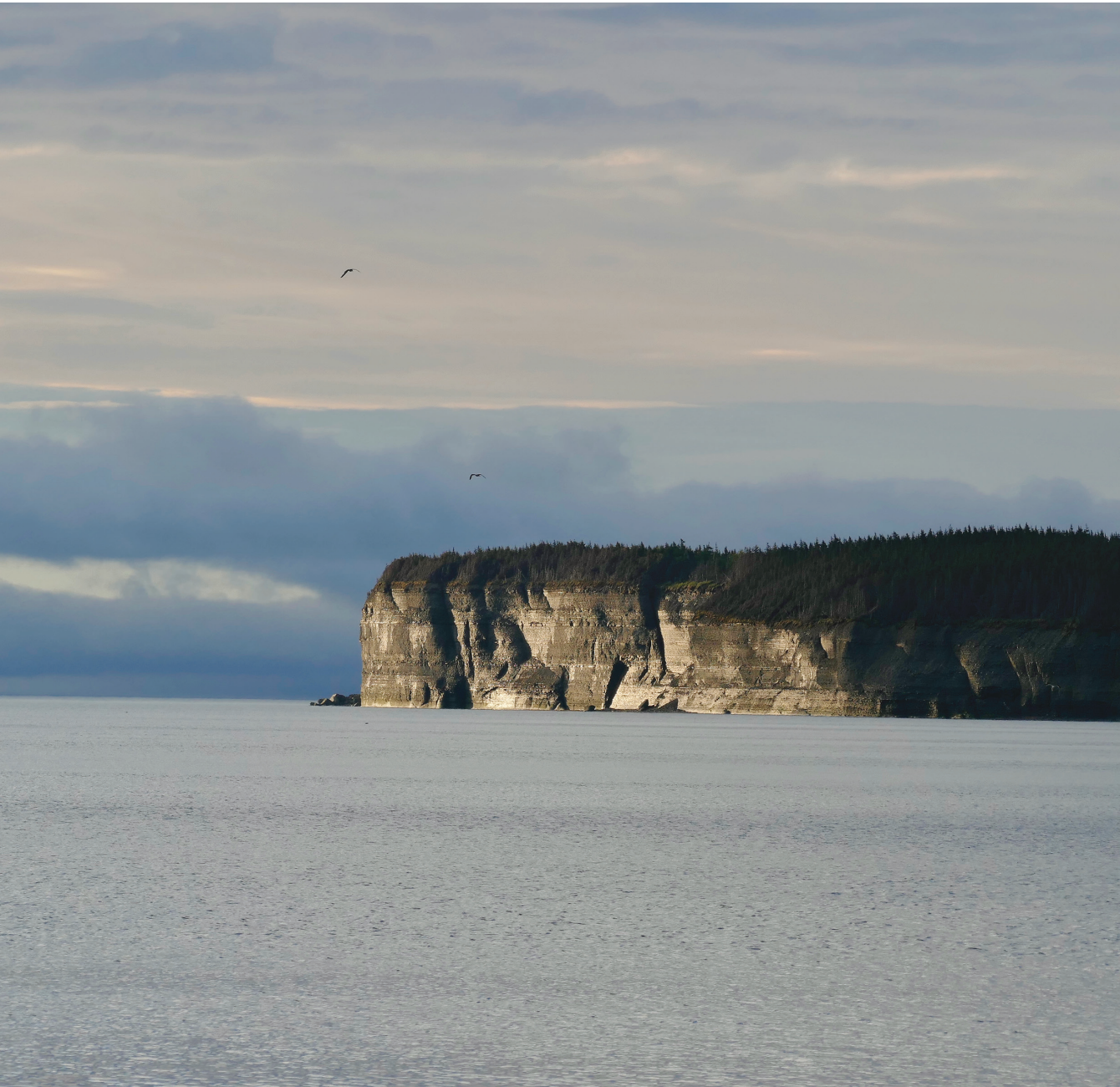
▲ Cap de la baie Maujerol, où se jette la rivière Vauréal.