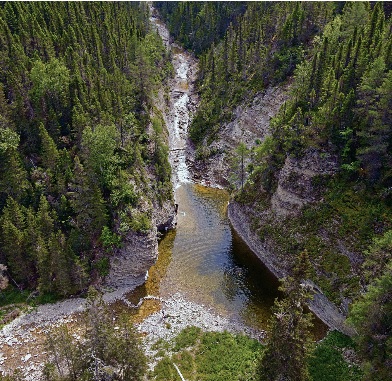
▲ Baignade à la chute Kalimazoo, un tributaire de la rivière à l'Huile.