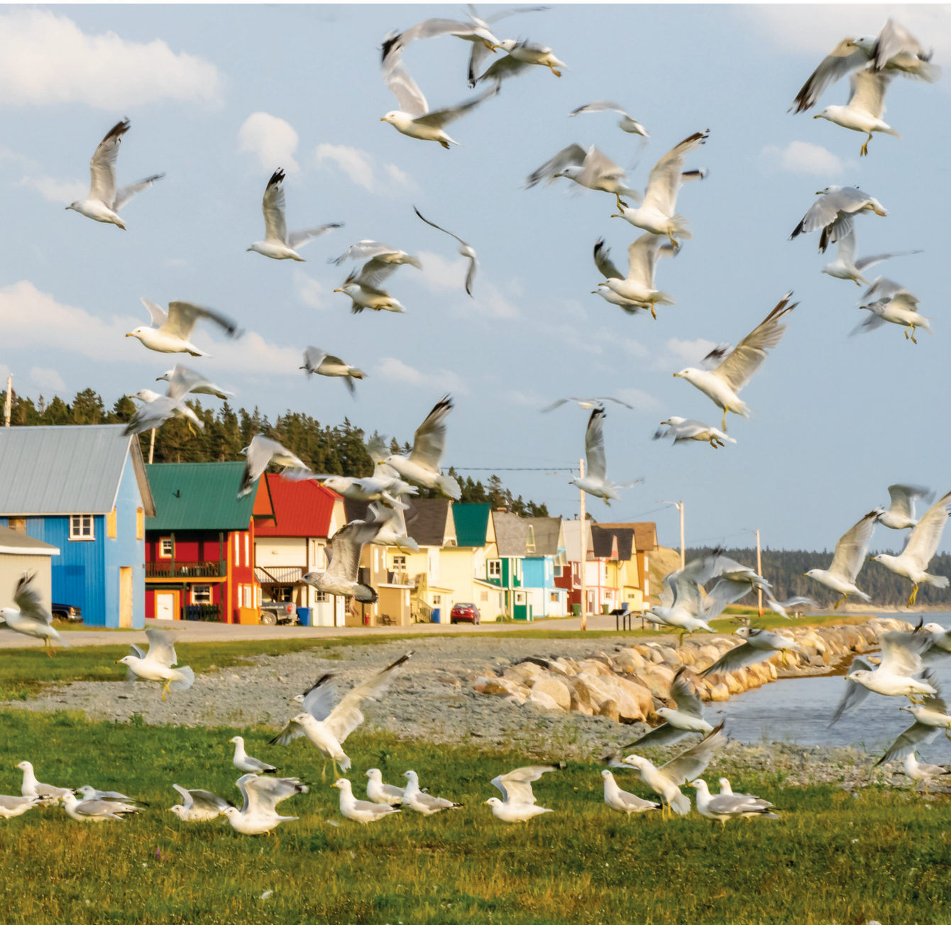
▲ Matin d'été sur la rue du Cap blanc à Port-Menier.