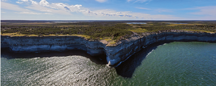
▲ Cap aux Goélands est situé sur la rive Nord, dans la réserve écologique de la Pointe-Heath.

des fossiles sont remarquables et permettent un travail scientifique de classe mondiale. »