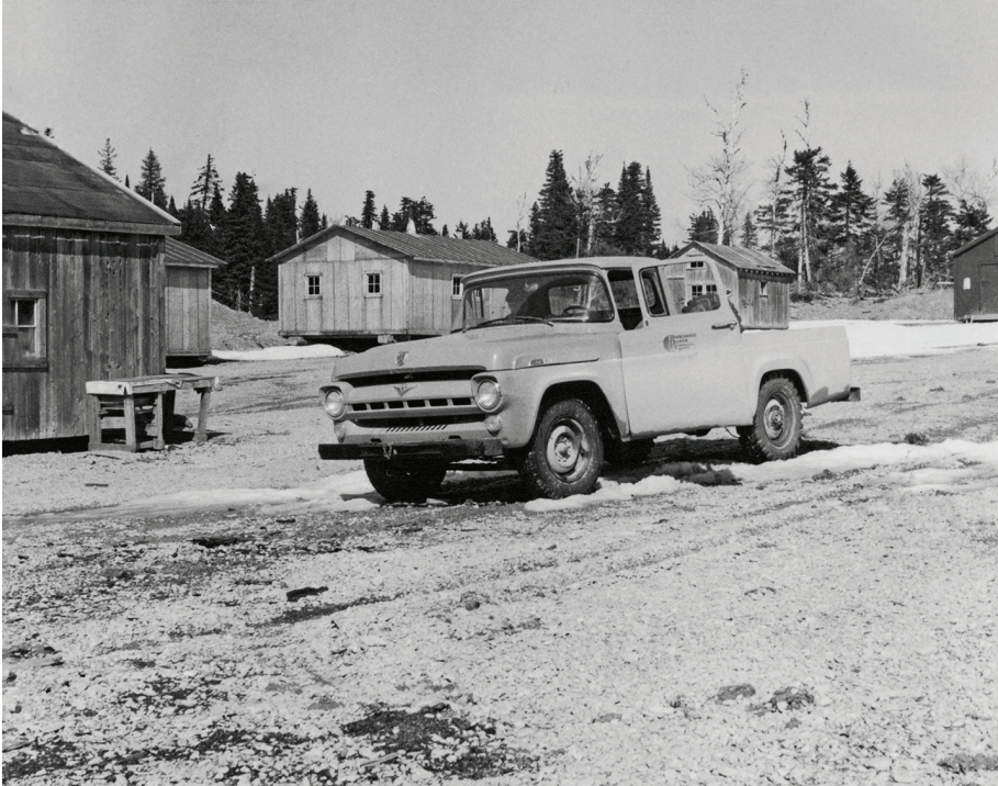
▲ Camps de travailleurs au printemps, en mai 1960.

« Dès notre arrivée, nous nous sommes heurtés à une difficulté que nous ne parvînmes pas à surmonter complètement : la méfiance. Les dirigeants de la compagnie craignaient que nous disions du mal de celle-ci. Malgré leur grande amabilité, nous sentions des réticences, voire des résistances. De l'autre côté de la barrière, même sentiment : on nous a pris d'abord pour des détectives, puis pour des employés de la compagnie, payés pour faire parler les gens. »