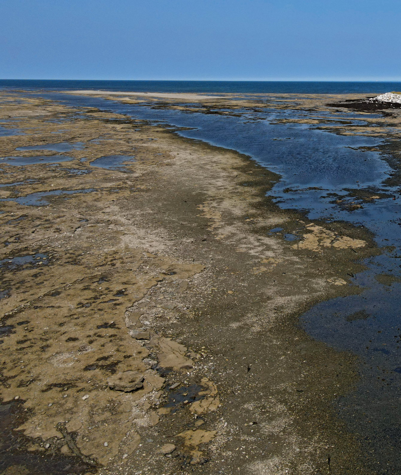
▲ Randonnée d'été sur la pointe Ouest.