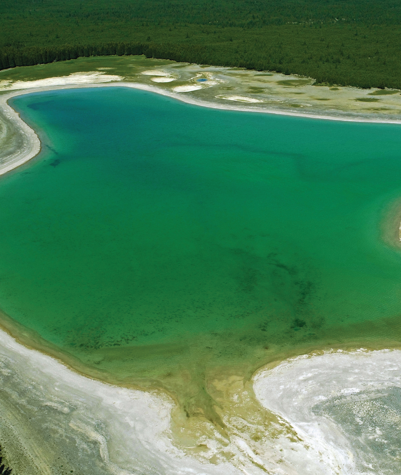
▲ Le lac Smith, situé sur le plateau central de l'île.