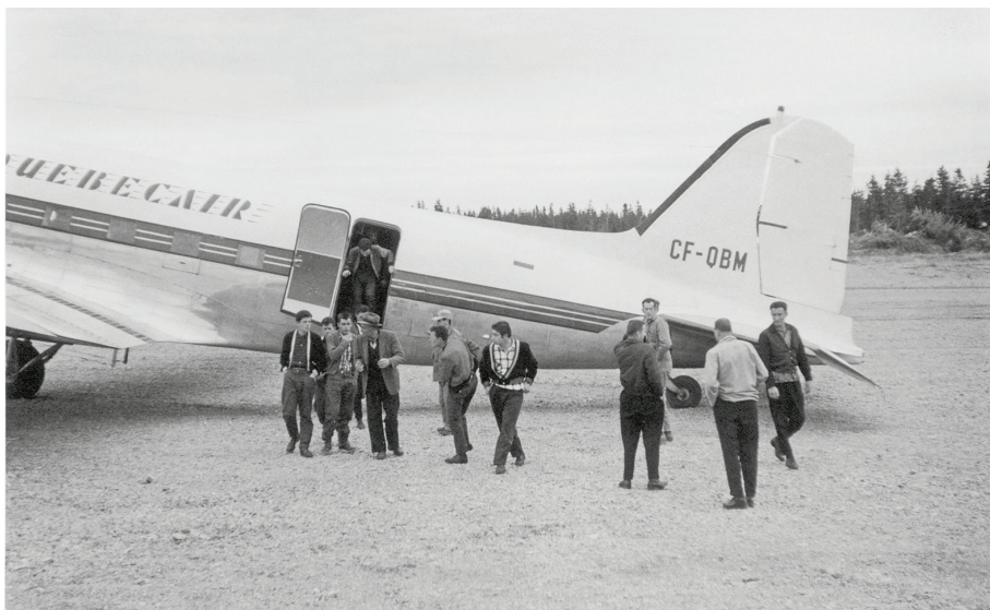
▲ Arrivée des travailleurs de la Consol avec Québecair vers 1959.