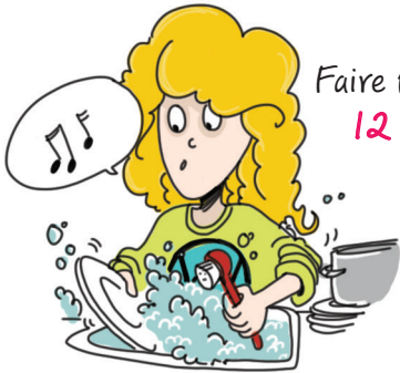
Faire la vaisselle 12 minutes

Entre les jours 14 et 19, j'ai de l'énergie à revendre!