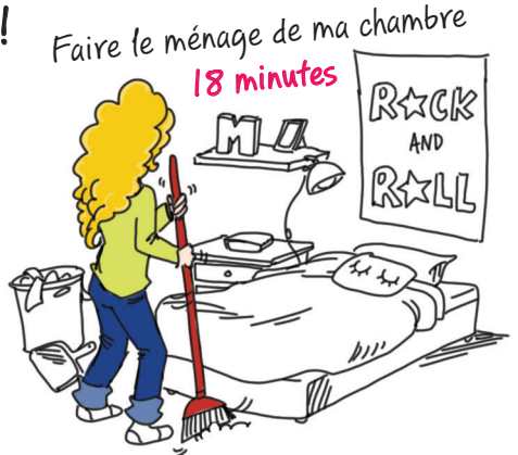
Faire le ménage de ma chambre 18 minutes