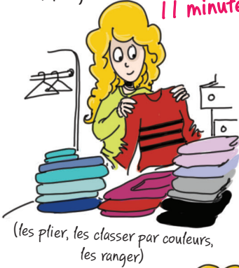
Ranger mes vêtements 11 minutes

(les plier, les classer par couleurs, les ranger)