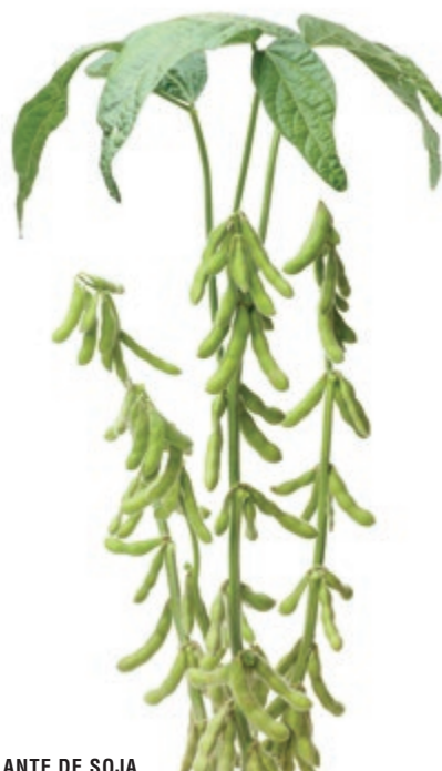
LA PLANTE DE SOJA

Leur grande valeur nutritive et leur haute teneur en protéines végétales font d'elles et de leurs dérivés des ingrédients de prédilection de l'alimentation végétarienne et végétalienne. Avec l'intérêt grandissant pour intégrer davantage de végétaux à notre alimentation, elles sont, plus que jamais, des aliments essentiels à découvrir (ou à redécouvrir !) et à ajouter dans nos assiettes.