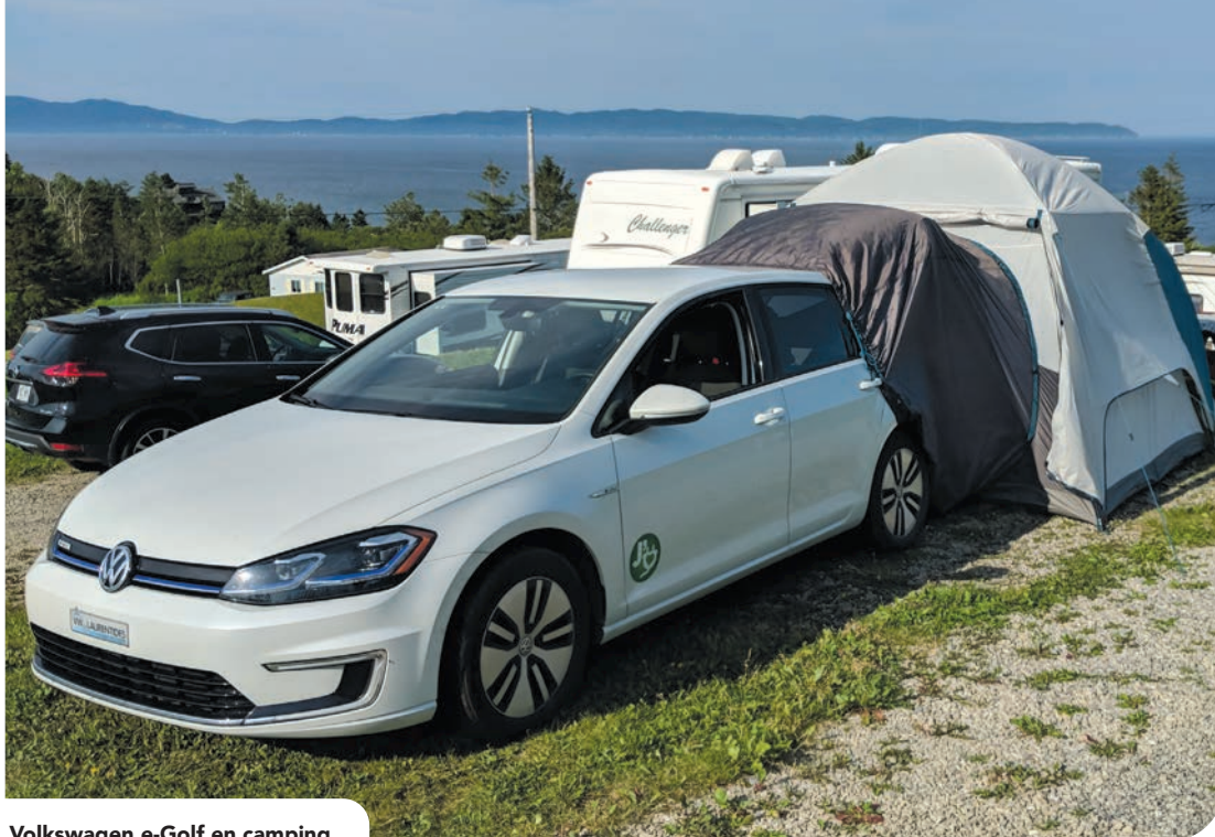
Volkswagen e-Golf en camping