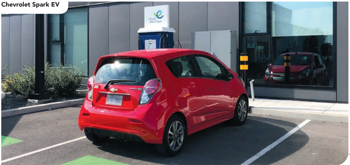
Chevrolet Spark EV