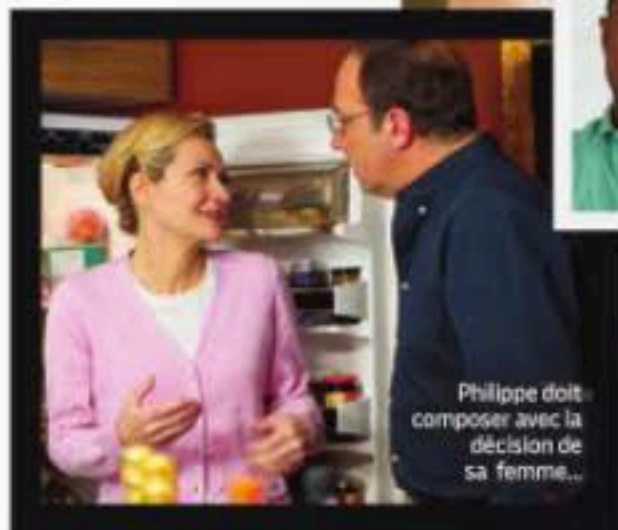
Philippe doit composer avec la décision de sa femme...