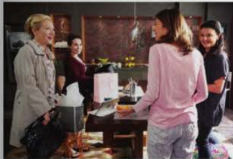
Au fil des ans, les trois femmes ont touché le public.

J'ai d'abord entrepris le roman Héléne , parce que c'est lui qui