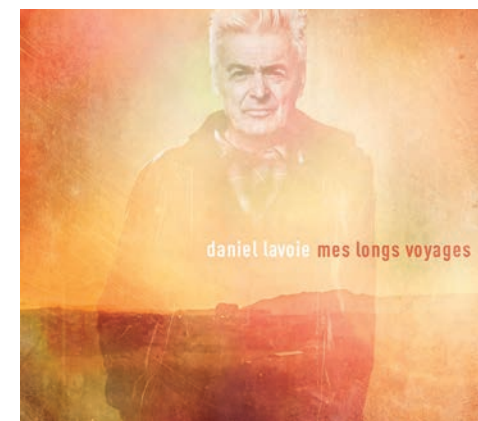
Mes longs voyages, de Daniel Lavoie (Spectra, 16 $).