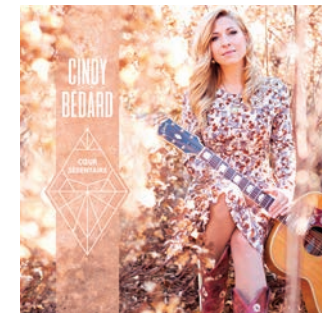
Cœur sédentaire, de Cindy Bédard (Audiogram, 13 $).