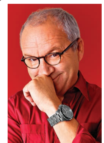
Drôle de vie, super-spectacle de Michel Barrette (pour les dates: lestroistilleuls.com).

Se remplir la panse et se dilater la rate le même soir? Un duo gagnant pour papa!