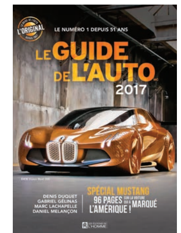
Le Guide de l'auto 2017, de Denis Duquet, Gabriel Gélinas, Marc Lachapelle et Daniel Melançon (Les Éditions de l'Homme, 35 $).