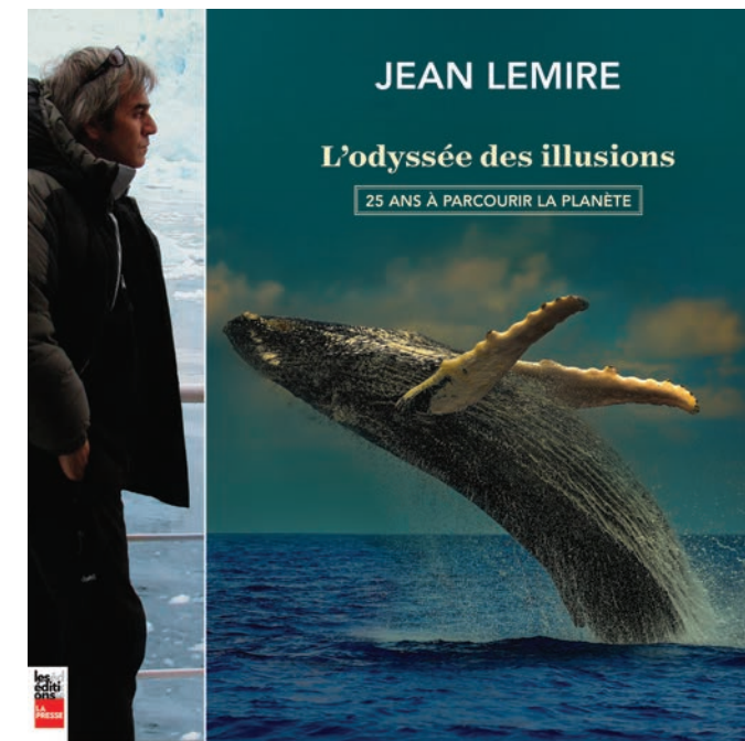
L'odyssée des illusions: 25 ans à parcourir la planète, de Jean Lemire (Les Éditions La Presse, 40 $).