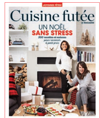
Cuisine futée, le magazine (KO Média, 10 $).