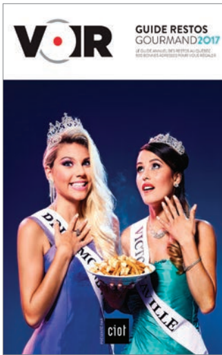
Guide restos Voir 2017 (Voir, 22 $).