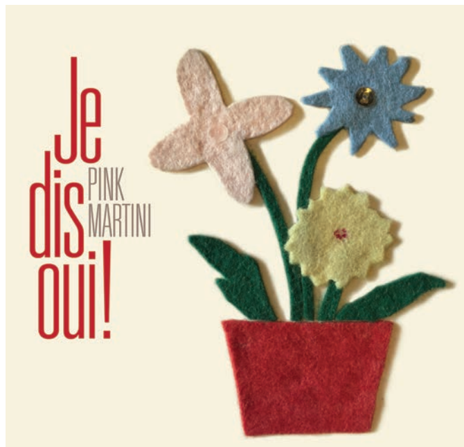
Je dis oui!, de Pink Martini (Audiogram, 13 $).

On ne se lasse pas de ce classique qui nous permet de savoir où aller manger sans se tromper.