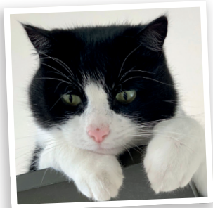
CHARLOT • Gembloux